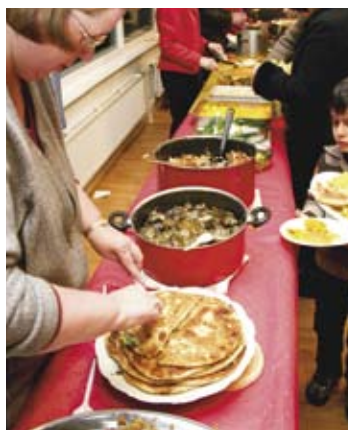
MATMIX | Delikatesser från bland annat Irak, Turkiet, Kina och Sverige skapar en härlig matmix på En Fest För Alla.