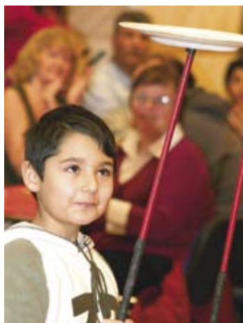
EN TRADITION | Mat- och kulturfestivalen anordnas den 12 november för nioende året i rad.

I lokalen Hallen dukas olika maträtter från världens alla hörn upp. Mat från Irak, Turkiet och Syrien trängs med mat från Sverige, Finland och Kina. Och många destinationer däremellan. Sedan får alla gäster botanisera fritt på avsmakningsbordet.