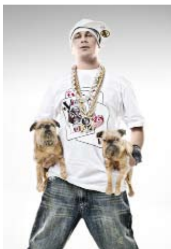
Markoolio | han lockade hela 13 600 personer när han besökte parken år 2000.